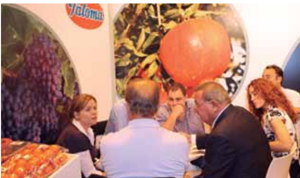
El equipo de G.H. Paloma, en plena negociación en Fruit Attraction 2013.