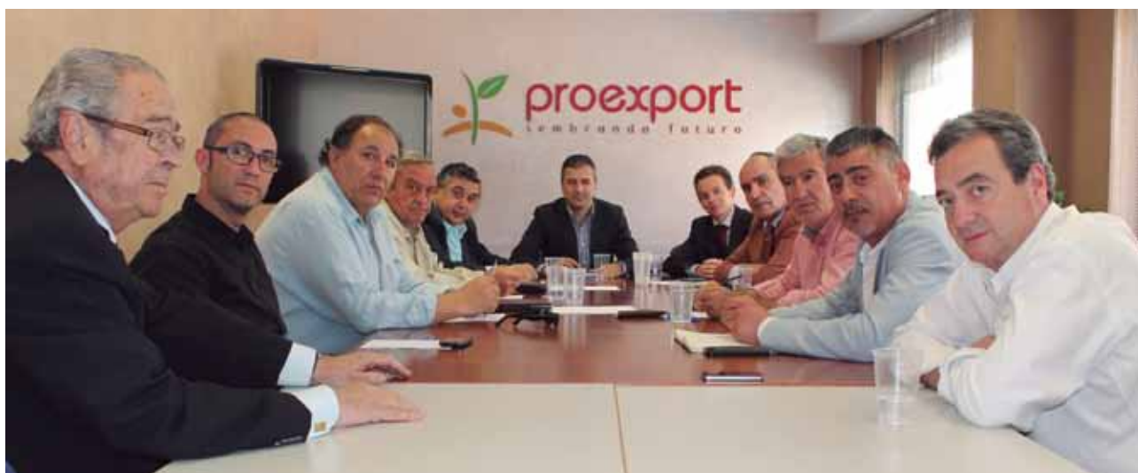
Organizaciones agrarias e ilustres amigos del sector colaboran en el "Monumento al Agricultor".