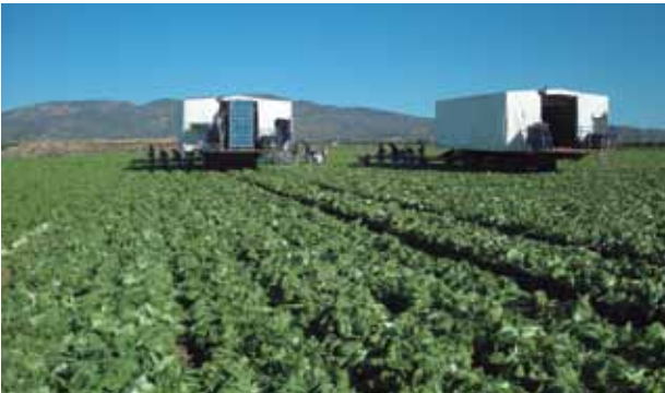
Invertimos en plataformas, invernaderos y en toda tecnología que nos ayude a ser mas eficientes y productivos