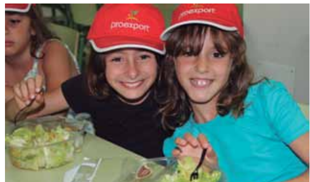
Alumnos participantes en el Programa de Fruta y Verdura en la Escuela.