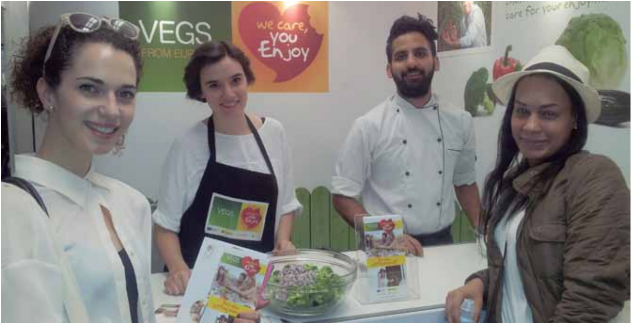
Las ensaladas We Care, You Enjoy triunfan entre el colectivo femenino en la feria Be: Fit de Londres.