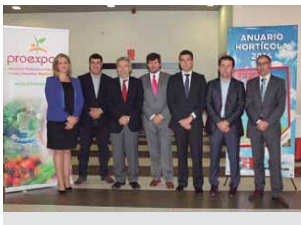
Presentación del Anuario Hortícola de FYH en Torre Pacheco.