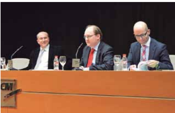
Presentación de la publicación sobre Iniciativas de RSC en la Región de Murcia.