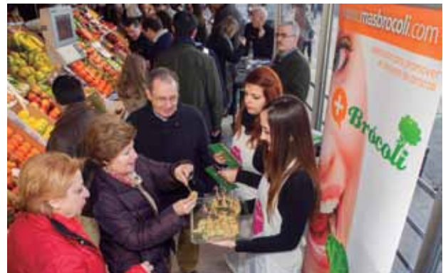
Degustaciones de tapas +Brócoli en el mercado San Miguel de Madrid.