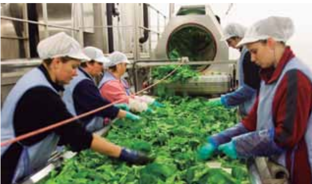
Seleccionamos el mejor producto en sus distintas variedades