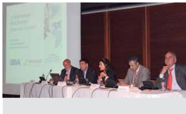
Jornada "Internacionalización del sector hortofrutícola", organizada por BBVA y PROEXPORT