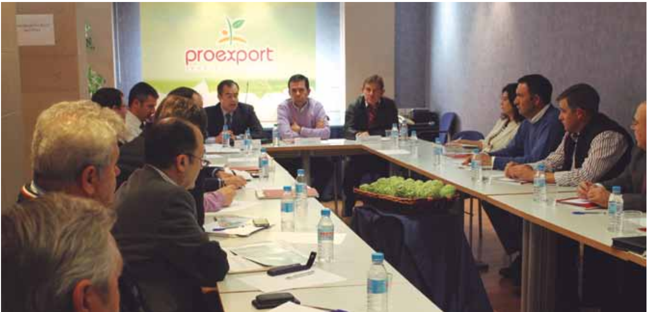
Empresarios de las alhóndigas de Proexport e industriales de Agrupal analizaron la difícil situación del mercado de pimiento y alcachofa transformada