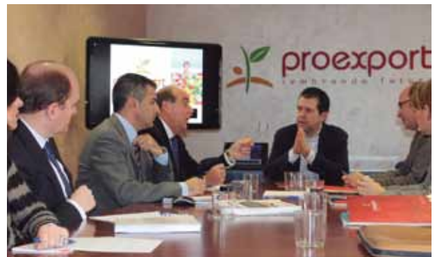
Reunión del equipo de Recursos Humanos de PROEXPORT con el consejero de Empleo, Pedro Antonio Sánchez.