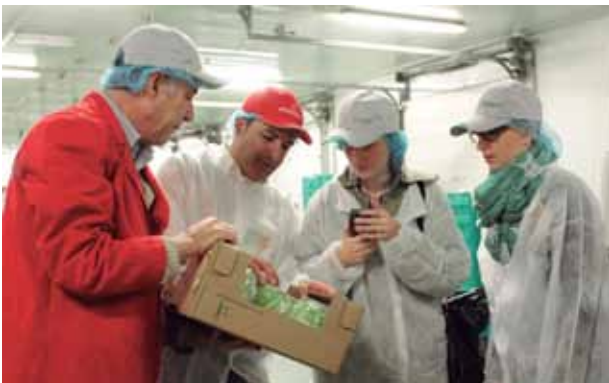
Periodistas internacionales conocieron el trabajo de las empresas que apoyan la campaña "We Care, You Enjoy" en noviembre de 2013.