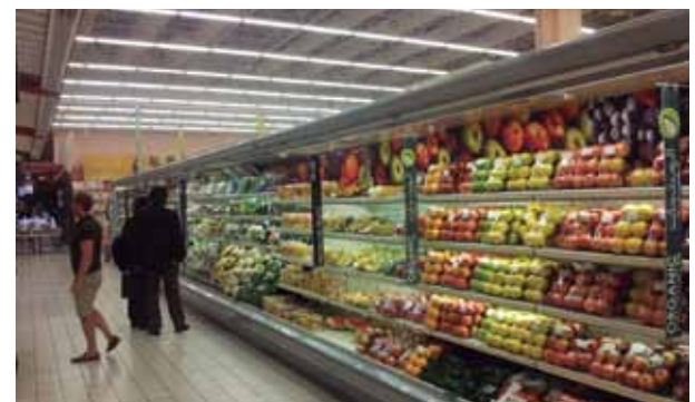
Una eficiente logística nos permite llegar a las tiendas de medio mundo con el producto más fresco