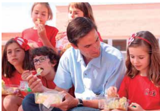
Niños del colegio Ays de Murcia degustan en el recreo la fruta repartida en el Programa Fruticoles 2013.