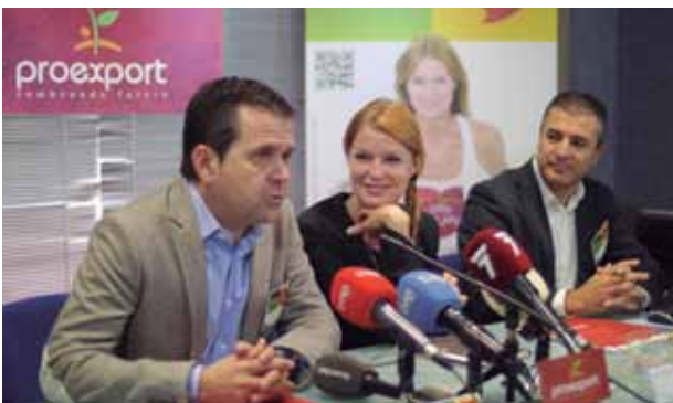
Rueda de prensa en PROEXPORT para evaluar las acciones de We Care, You Enjoy.