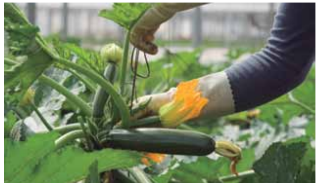
Manos hábiles guían la planta en invernadero para lograr el mejor fruto