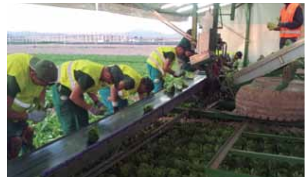
Trabajadores en plataforma cosechan en el momento óptimo de maduración