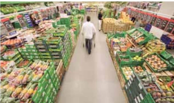
La sección de fruta y verdura atrae a la mayoría de consumidores