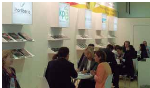
Actividad de las empresas murcianas en World Food Moscu 2013.