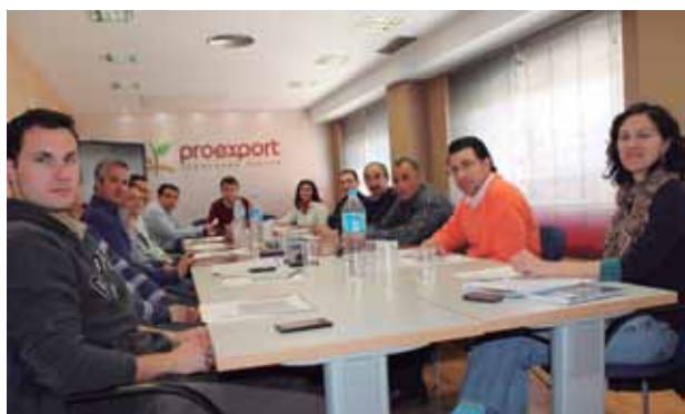
Reunión técnica en PROEXPORT sobre cucurbitáceas.