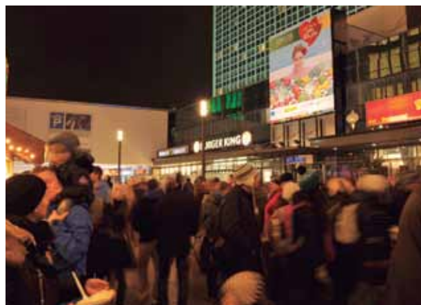
El megaposter de We Care, You Enjoy, presente en la navidad berlinesa de Alexander Platz.