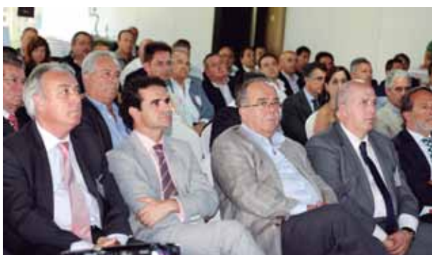
Representantes de entidades financieras y organizaciones del sector asistieron a la Asamblea.