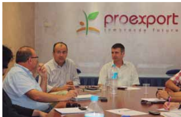
Reunión técnica con responsables de la Consejería de Agricultura sobre cultivos menores.