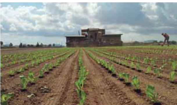
Trasplantamos en campo con sumo cuidado esperando recolectar meses después