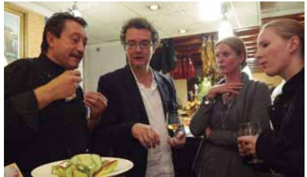
Invitamos a la restauración a hacer maravillas con nuestros productos