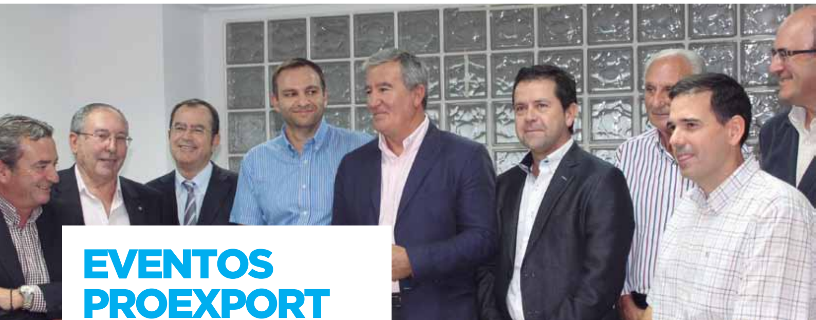
En Proexport apostamos por un sector unido y competitivo.