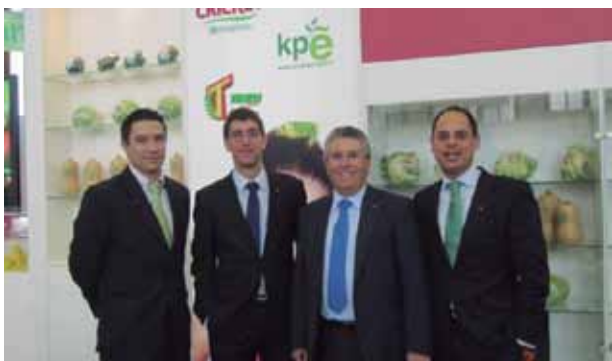
La delegación comercial de Kettle Produce desplazada a Fruit Logística 2014.