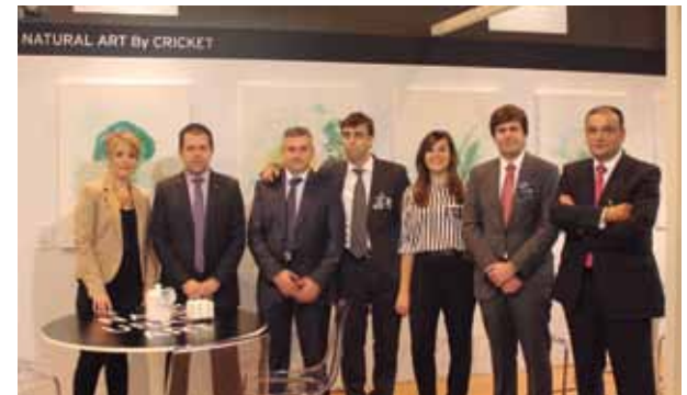
Equipo de Campo de Lorca desplazado a Fruit Attraction 2013.