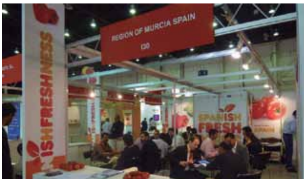
Espacio dedicado a las empresas de la Región de Murcia en Wop Dubai 2013.